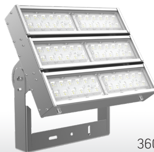
Olymp 2.0 GL CLEANpro 150Вт