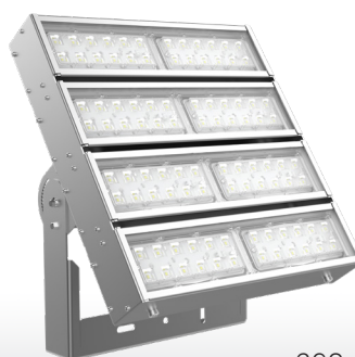
Olymp 2.0 GL CLEANpro 200Вт