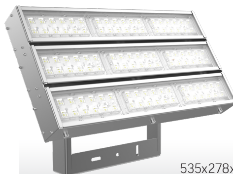
Olymp 2.0 GL CLEANpro 250Вт