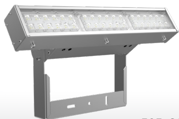
Olymp 2.0 GL CLEANpro 75Вт