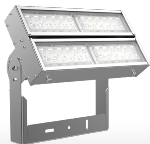
Olymp 2.0 GL CLEANpro 100Вт