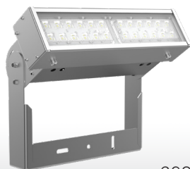
Olymp 2.0 GL CLEANpro 50Вт