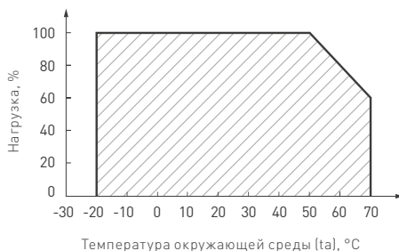
Рисунок 2. Максимальная допустимая нагрузка, % от мощности источника