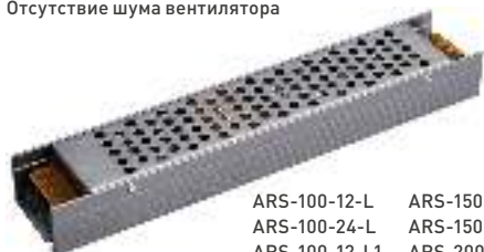
ARS-100-12-L ARS-150-12-L ARS-100-24-L ARS-150-24-L ARS-100-12-L1 ARS-200-12-L ARS-100-24-L1 ARS-200-24-L