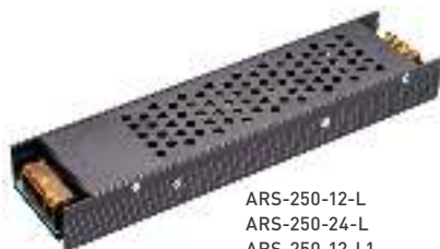
ARS-250-12-L ARS-250-24-L ARS-250-12-L1 ARS-250-24-L1