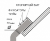
Схема крепления / подключения